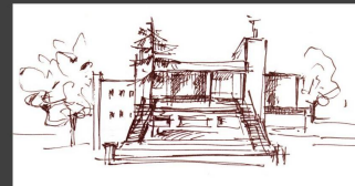
MGOK w Żelechowie

W sobotę 28 września w godz. 10.00-14.30 odbędzie się Rajd Rowerowy dookoła Gminy Żelechów