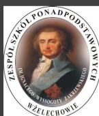
Zespół Szkół Ponadpodstawowych w Żelechowie